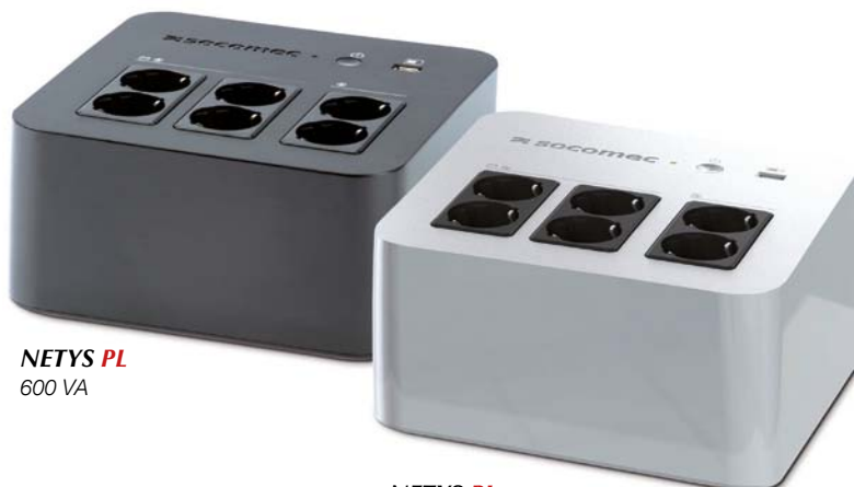
NETYS PL 600 VA